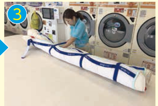
3 形を整えながら、青のマジック ベルトで4か所すべて固定します。