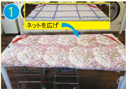
1 ネットを広げ ネットの上にふとんを置き、 奥側の角を赤いバンドに挟み入れます。