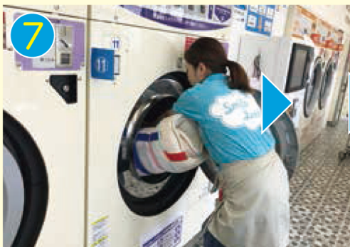
7 両サイドを入れ込みます 少しかがむと入れやすいですよ！