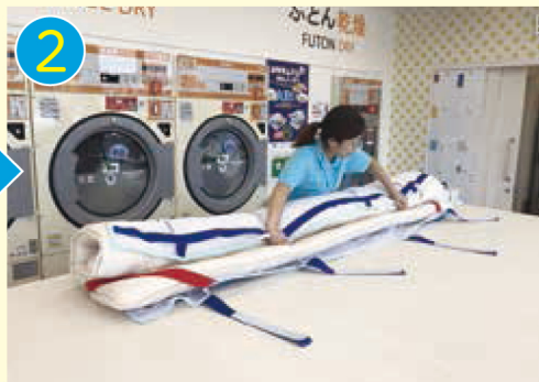
2 ふとんを手前から巻き込みます。