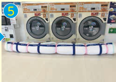
5 中の綿がよれるのを防止する ため、しっかりと巻いてください。