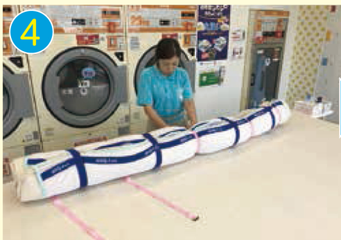
4 さらにピンクのバンドで数か所固定。 (青のベルトの間につけるように)