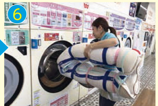
6 布団を半分に折り、畳んだ輪の方 を奥にして洗濯乾燥機に入れます。